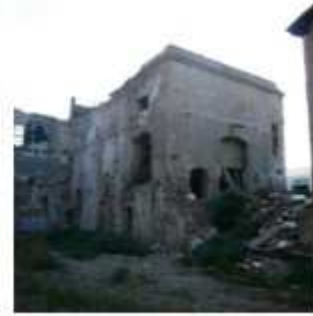
Imatges de les naus