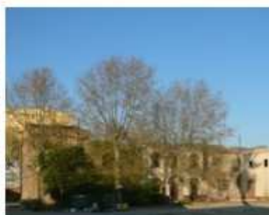
Imatges de l'estat actual