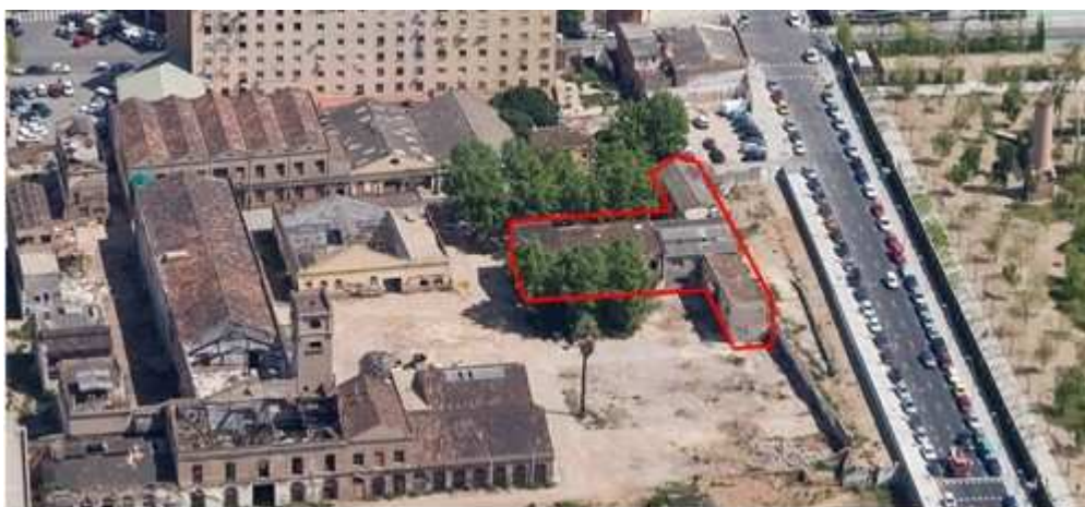
Vista aèria del conjunt