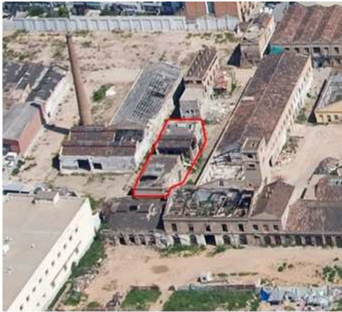
Vista aèria del conjunt